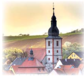
St. Andreas Remlingen